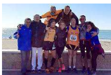
Una foto del gruppo orange dopo la gara