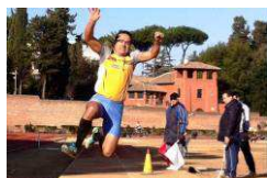
Oltre la corsa anche salti e concorsi ...

L'Atletica Leggera è spesso chiamata la "Regina" degli sport perché ha origini antichissime e racchiude tutte quelle specialità che sono naturalmente nate con l'uomo, che aveva bisogno di correre e saltare per cacciare e combattere, oppure lanciare pietre e bastoni per colpire le prede.