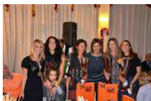
Una fase della premiazione dei Criterium del 2014

Siamo all'epilogo di questo anno speciale per tutti noi Orange, una celebrazione importante che segna il ventennale della nostra società, fatto di solidarietà, corsa, sacrificio, sudore ma anche tantissime soddisfazioni!