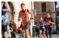
Ultimi sforzi prima del traguardo

La "Maratonina dei Tre Comuni" rappresenta per me una gara particolare, davvero molto sentita nonché un appuntamento immancabile del mio personalissimo calendario podistico. Infatti, nonostante abbia iniziato a correre da relativamente poco tempo, questa è l'unica gara insieme alla Speata di cui non mi sono mai perso un'edizione. Masochista? Probabilmente sì ... ma vi posso garantire che, nonostante la durezza del percorso, il grado di soddisfazione che si raggiunge superando il traguardo finale è veramente elevato e ripaga tutta la fatica che si prova per portarla a termine.