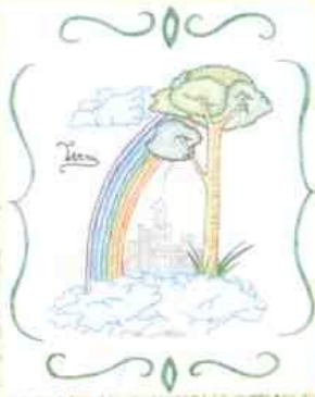
Logo 2008 MAULINI ALTHEA Scuola Media De Filis

Raduno ore 8.30 Presso il Parco di Viale Trento-Partenza ore 10