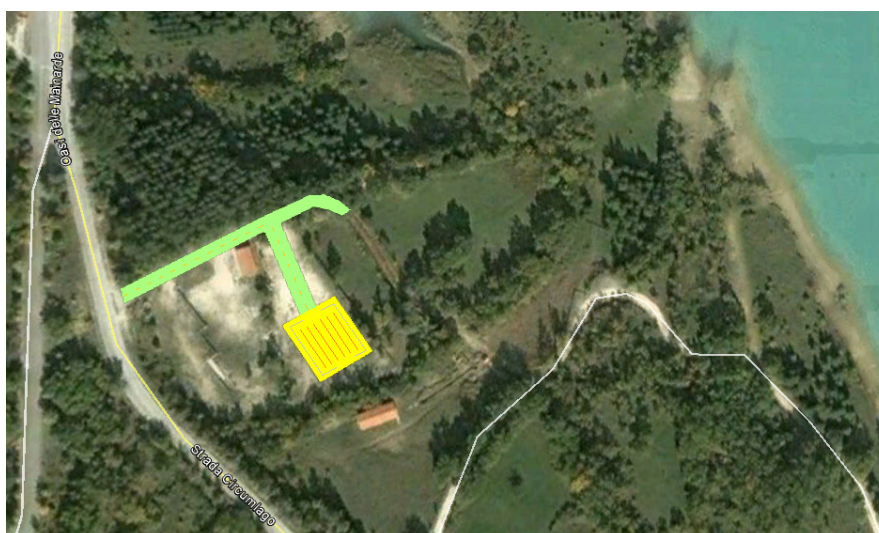
FLUSSI ZONA CAMBIO

La zona cambio sarà posizionata all'interno del camping "Oasi Delle Mainarde", pertanto gli atleti percorreranno 200 m tra l'uscita nuoto e l'ingresso in zona di transizione. Sono previste linee di stralli paralleli che ospiteranno un minimo di 400 atleti.