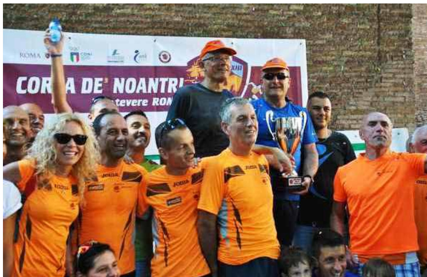
Gli orange festeggiano la vittoria societaria alla Corsa de' Noantri

Siamo oramai in piena estate, il caldo non dà tregua ma nonostante ciò gli atleti orange hanno risposto presente a quasi tutte le manifestazioni podistiche che si sono svolte in questo mese di Luglio portando a casa tanti ottimi risultati sia a livello societario che a livello individuale.