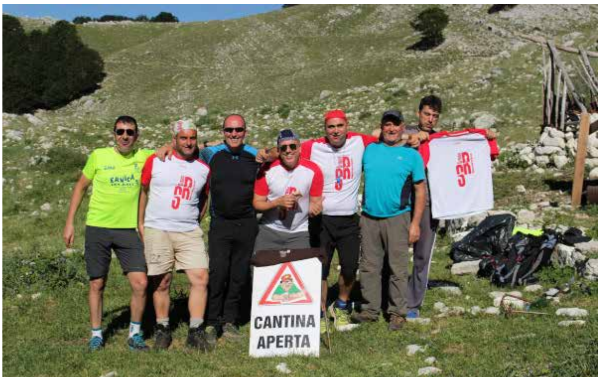
Super ristoro del Trail Collepardo

Buon divertimento a tutti!. Alé Podistica!