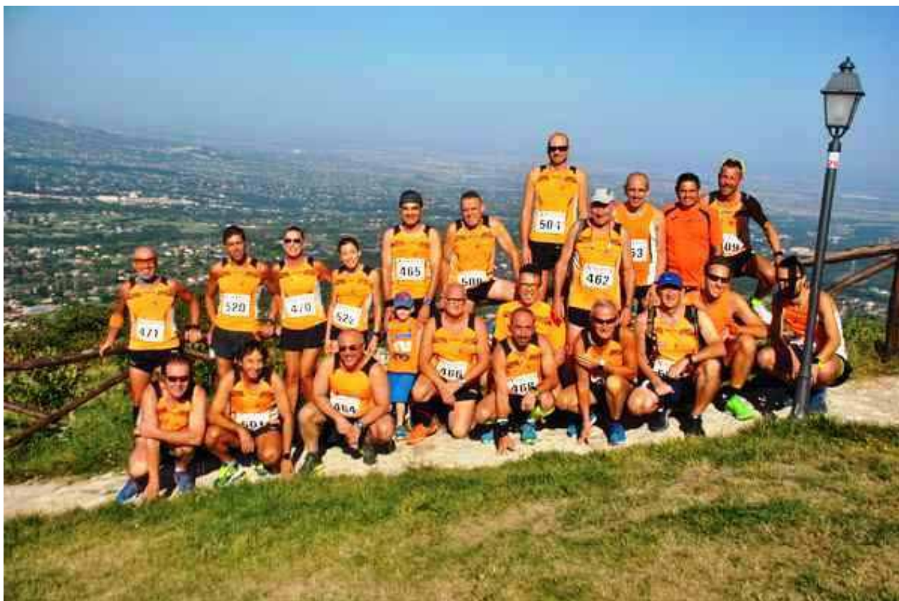
Gli orange posano per la foto di gruppo con il meraviglioso paesaggio che si gode dalla cittadina laziale - 2018

Il percorso, interamente su strada asfaltata e chiusa al traffico, è ondulato. Dalla partenza si scende per uscire dal paese e immettersi nella strada provinciale per Capranica che con continui saliscendi ci porterà al ristoro posizionato al 4º chilometro; qui si tirerà un pochino il fiato su un rettilineo di circa 1000 metri, percorrendo la