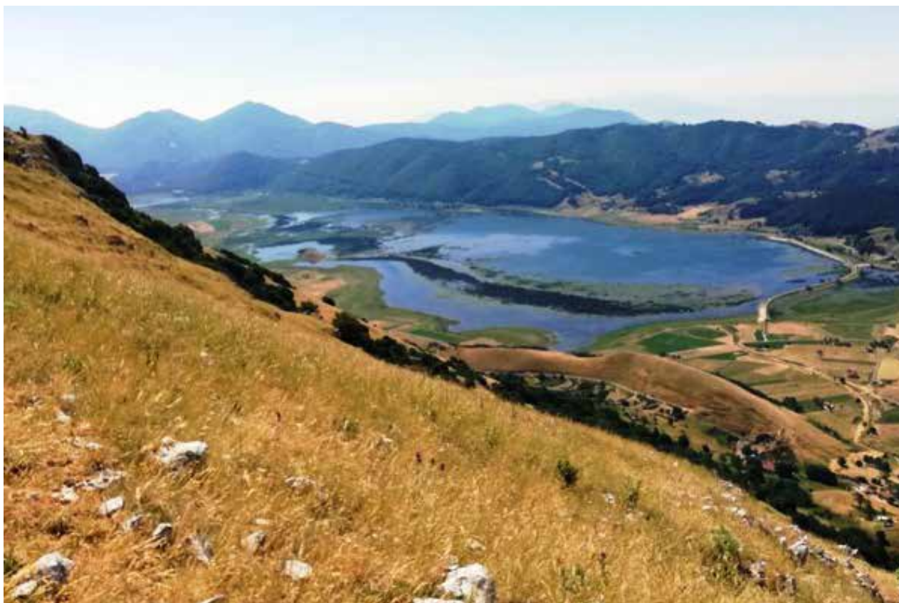
Il lago del Matese