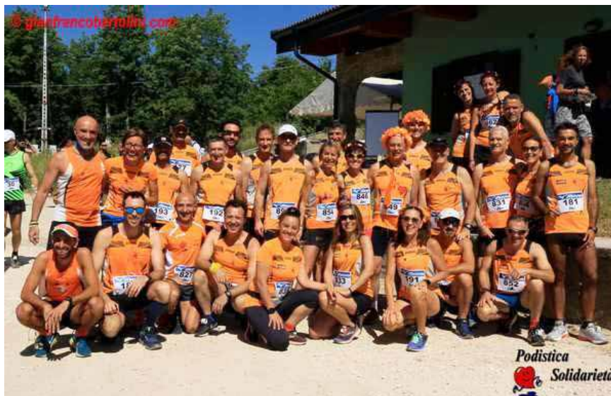
Gli orange presenti al Giro del Lago di Campotosto

Il mese di Giugno coincide con l' arrivo dell'Estate, periodo in cui molti atleti lasciano la Capitale per una meritata vacanza al mare o sui monti; ma nonostante ciò tantissime sono le presenze orange nelle varie gare che si svolgono a Roma e soprattutto nei tanti caratteristici borghi di provincia. Tantissimi successi sia per la Società che per gli atleti che vi andiamo subito a riepilogare.