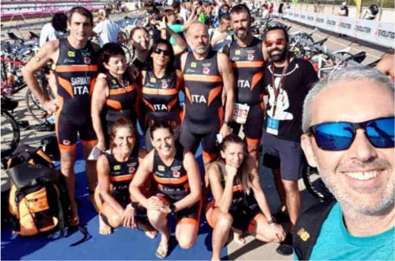
Lo squadrone orange di triathlon

Ultima gara della stagione tempo di bilanci. I numeri raccontano di 11 gare di triathlon che per un esordiente non sono proprio poche: 10 gare Sprint e 1 Olimpico che inizia ad essere una distanza sicuramente "più impegnativa". Ma al di là delle fredde statistiche quello che effettivamente conta sono le emozioni che questo meraviglioso sport è riuscito a darmi.