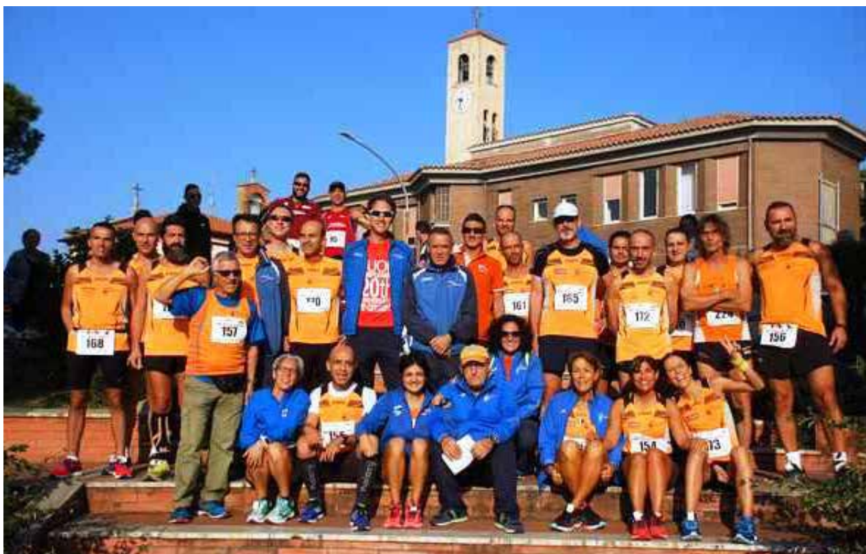
Gli orange posano tutti insieme per la tradizionale foto di gruppo davanti alla Chiesa di Santa Croce