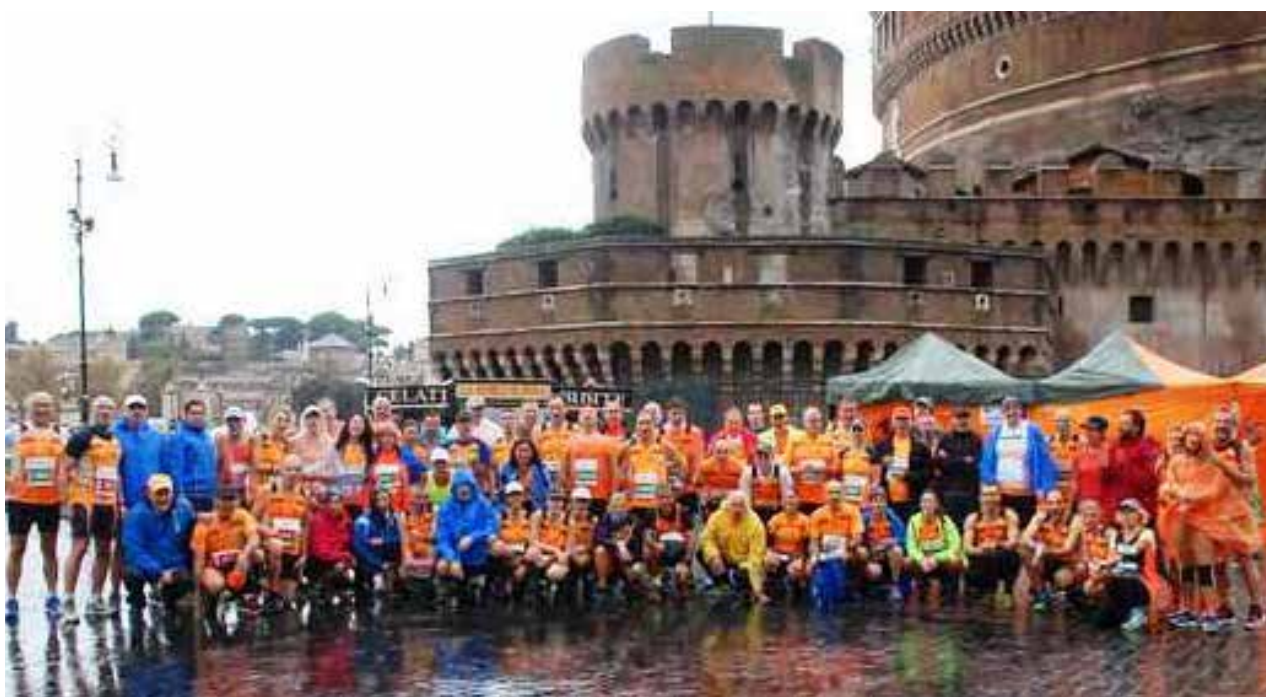
I nostri orange, riuniti per la foto di gruppo, non temono la pioggia!!!

Il tempo massimo della gara è fissato in 1 ora e 30'; saranno previsti un ristoro intermedio ed uno finale. E' previsto inoltre un deposito borse che sarà disponibile nei pressi della partenza e arrivo.