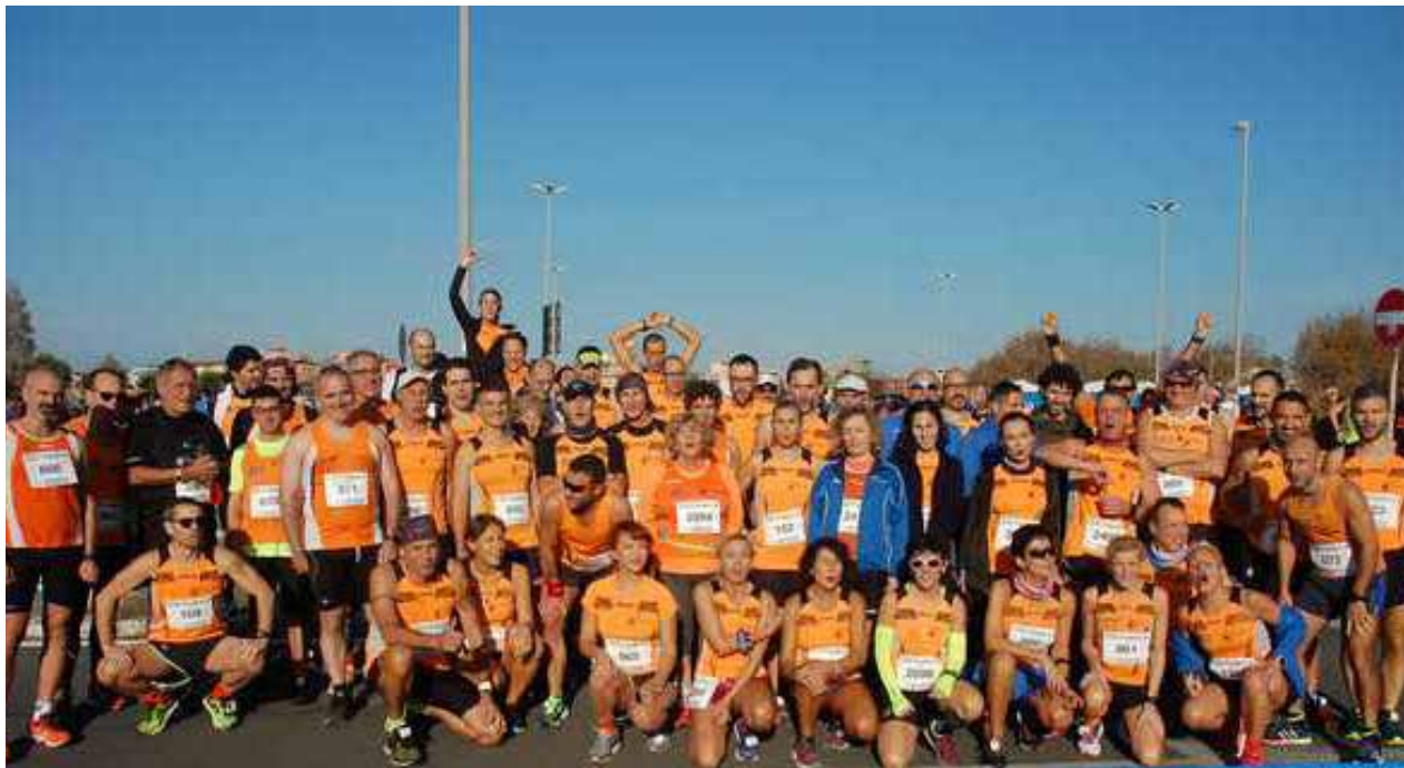
Foto di gruppo Podistica Solidarietà nell'edizione 2018 della "Maratonina Città di Fiumicino"

Domenica 10 novembre 2019 si disputerà la 17ª edizione della "Maratonina Città di Fiumicino" offrendo la possibilità di competere su percorsi interamente pianeggianti e asfaltati nelle due distanze di 21,085 km e 10 km. E' prevista anche una non gara non competitiva di 10 Km.