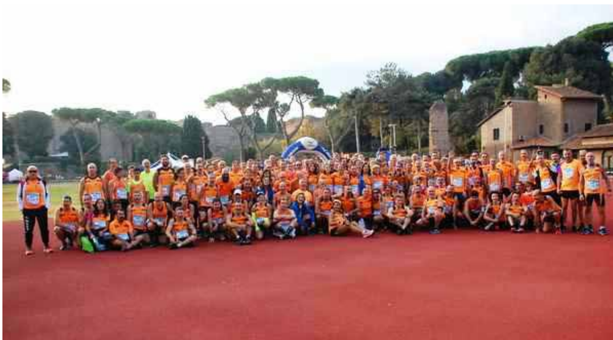
Il grande gruppo Orange della Roma Urbs Mundi 2018

Sono previste 3 griglie di partenza: la prima destinata ai top runner (pettorale blu); la seconda a tutti gli altri atleti della gara competitiva di 10 km (pettorale verde acqua); la terza a tutti i partecipanti della corsa non competitiva di 15 km (pettorale viola).